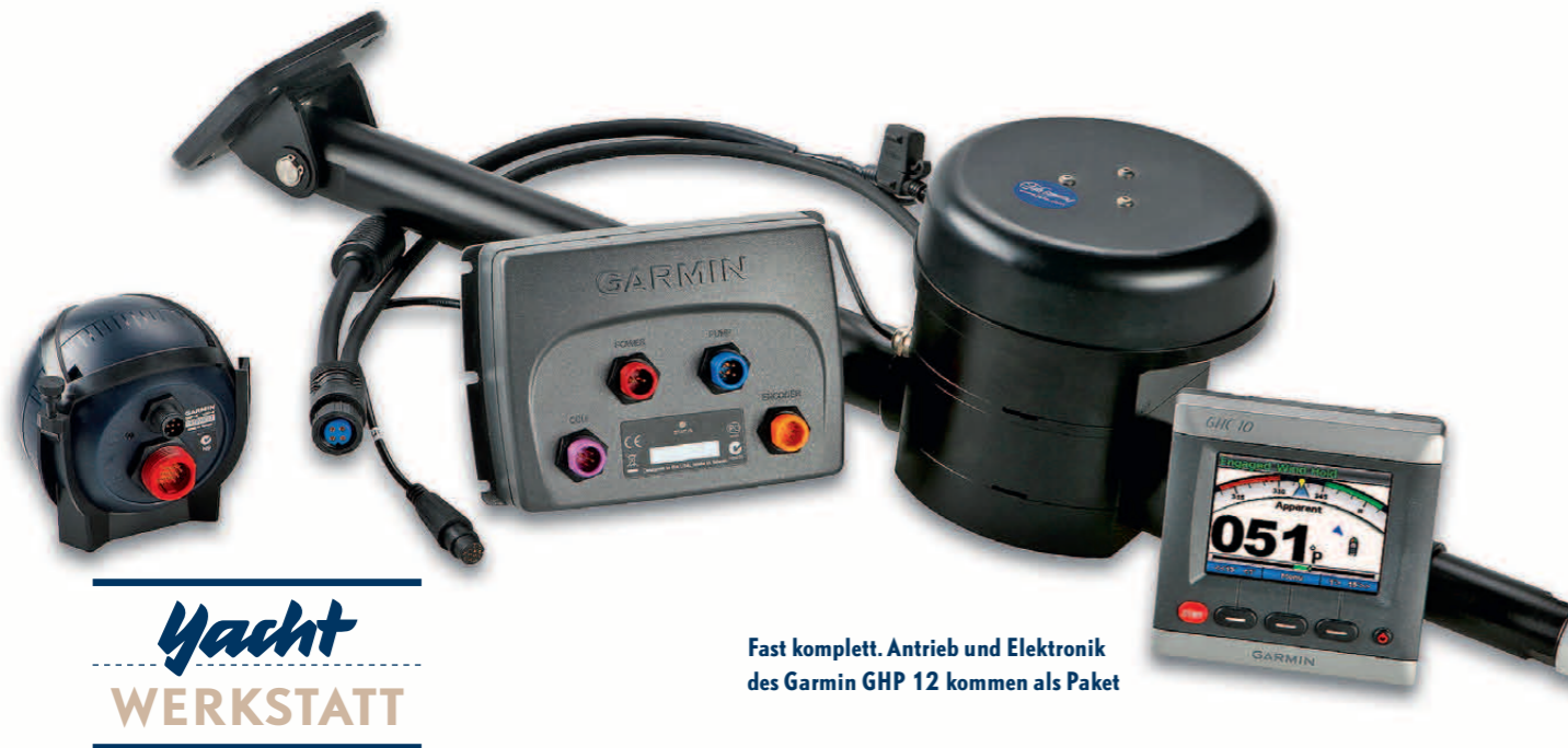
Fast komplett. Antrieb und Elektronik des Garmin GHP 12 kommen als Paket

INNOVATION, TIPPS & TRICKS RECHT, BÜCHER